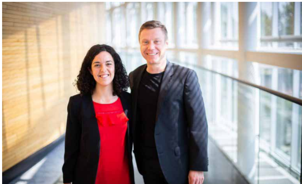
Manon Aubry (La France Insoumise) und Martin Schirdewan (DIE LINKE) werden die Fraktion für die erste Hälfte der Wahlperiode führen.

Cornelia Ernst berichtet vom Sommer im Europäischen Parlament in Straßburg