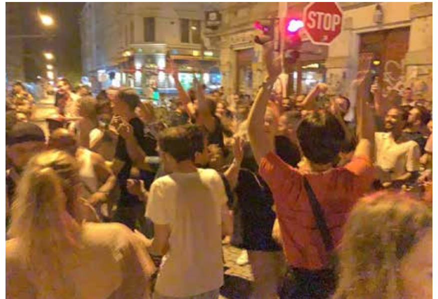
We like to ... move it! move it! Wahlkampf-Abschluss-Movement mit den Jusos Dresden, Grüne Jugend Dresden und der Linksjugend am 31. August im Alaunpark