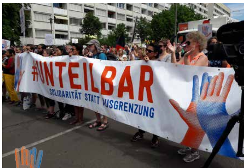
Zehntausende Menschen aus dem gesamten Bundesgebiet kamen am 24. August nach Dresden.