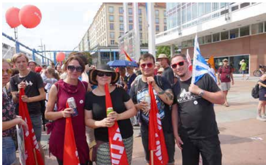
#unteilbar. Dass Solidarität zu jeder Zeit und an jedem Ort gelebte Realität werden kann, zeigten Dresdner LINKE gemeinsam mit tausenden Menschen aus der ganzen Republik am 24. August in Dresden.